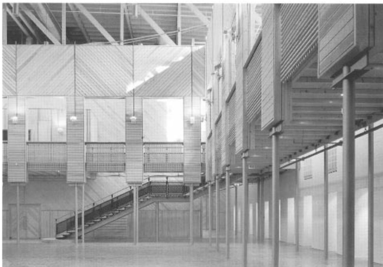
Theater aan de Schie, Schiedam - Hans Ruijsenaars, de architectengroep rijntout ruijsenaars hendrik van gameres rustenbroek

zicht van dat ontwerp toont twee in elkaar grijpende zeshoeken, als stralmen voor het samenbrengen van de beide krachten. De nieuwe, grote zaal vertoont nog enige gelijkenissen met dat uitgangspunt, maar het publiek zit nu op de balkons en rondom de parterre 'en ronde' in plaats van in geknikte rechte lijnen.