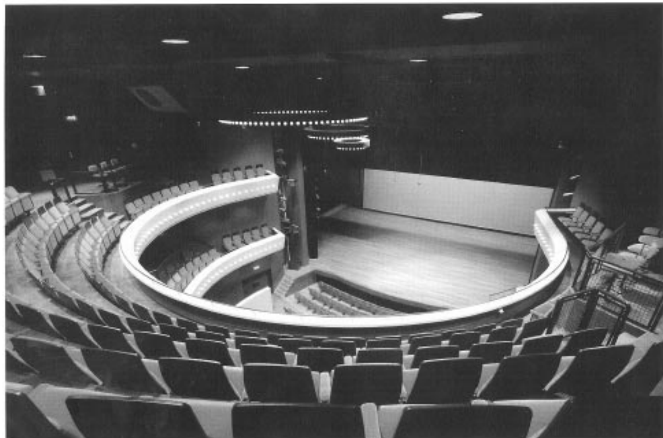
Tamboer II, Hoogeveen - Ossi Greiner Martien van Goor Architecten

lega Ballieux (van Alberts & Van Huut), die de nieuwe schouwburg in Hoorn heeft ontworpen, kreeg juist nadrukkelijk te maken met de huidige leiding van de Park Schouwburg die uitgesproken ideeën had over de programmering en het karakter van het publiek heeft. Ergens in 2000 zal het nieuwe complex (de Hoorse Hop) de functie van de Park Schouwburg overnemen. Zo'n dialoog tussen architect en opdrachtgever kan inspirerend zijn - zoals hier in Hoorn het geval was.