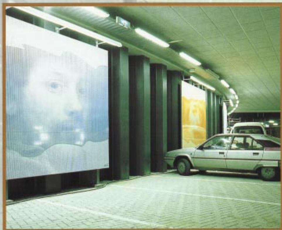
Zeshonderd parkeerplaatsen onder het Museumplein.

De herinrichting van het Museumplein in Amsterdam bevindt zich in een vergevorderd stadium. Na vele eerdere gedaantewisselingen van het Museumplein wordt het straks een aantrekkelijke open stadsruimte in het hart van de hoofdstad. Maar de inrichting blijft niet beperkt tot de bovengrondse aanpak van de openbare ruimte, want onder het maaiveld van het Museumplein liggen twee fonkelnieuwe ondergrondse parkeergarages, gecombineerd met een supermarkt. Misschien zijn deze ondergrondse bouwwerken van een iets andere orde dan de buiteninrichting, maar ze blinken uit in openheid én overzichtelijkheid. Op zaterdag 3 juli kon het publiek bij de officiële opening van deze parkeergarages met eigen ogen aanschouwen welk resultaat deze ondergrondse bouwprojecten hebben opgeleverd.