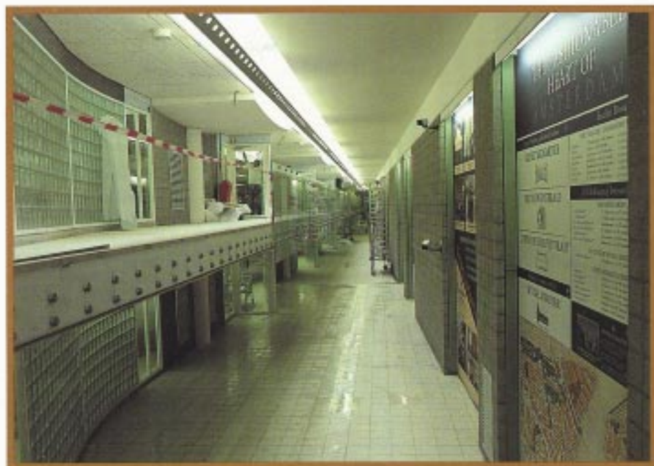
Fluin opgezette ondergrondse verblijfsruimten. De hoogte varieert van 3,20 meter tot 4,50 meter.

Van Baerlestraat, tussen de Museum-promenade en uitbreiding van het Stedelijk Museum.