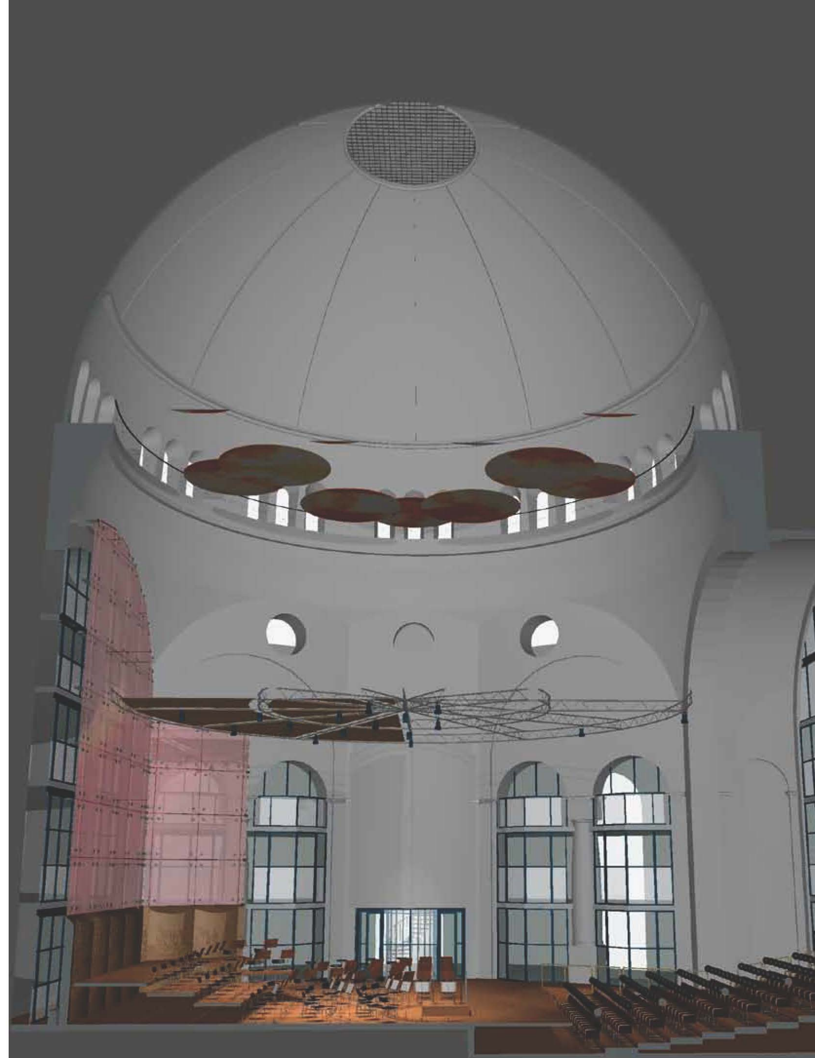
Ontwerptekening grote zaal, 2010, Zaanen Spanjers cs Architecten.