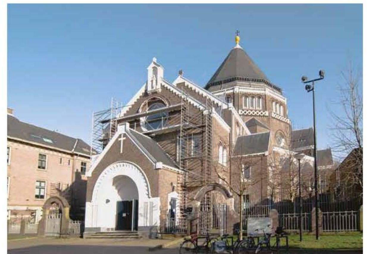
Gerardus Majellakerk in restauratie, 2011, foto Ernest Annyas.

We bevinden ons in de Indische buurt in Stadsdeel Oost, dat als een klaverblad gegroepeerd ligt, grofweg tussen het spoor naar Utrecht - Hilversum en het Flevopark. De wijk dateert grotendeels uit het begin van de twintigste eeuw. De eerste straatnamen, die zijn vernoemd naar eilanden en andere geografische aanduidingen in de voormalige kolonie Nederlands-Indië, dateren uit 1902.