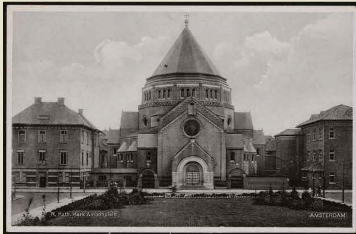
Gerardus Majellakerk met omringend complex en Ambonplein, 1930, prentbrijskaart.