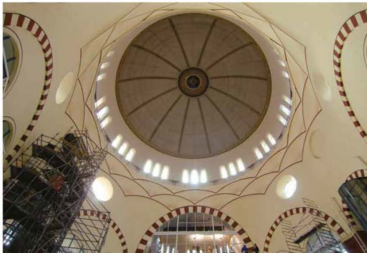
Koepelgewelf en steigerconstructie, 2011, foto Ernest Annyas.