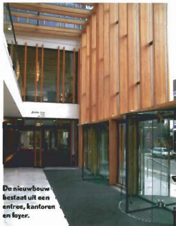
De nieuwbouw bestaat uit een entree, kantoren en foyer.