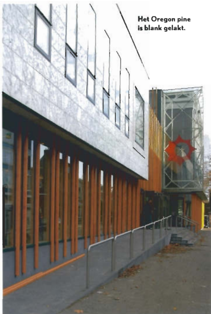
Het Oregon pine is blank gelakt.